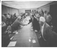
Centrale aanbevelingen inzake aspecten van een werkgelegenheidsbeleid