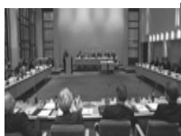
Of - vanmiddag nog - het SER- gebouw